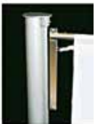
Mastkopf mit Langschlitten, Teleskopausleger