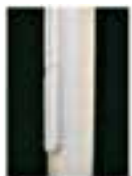
Belegklampe mit aufliegendem Deckel, sperrbar