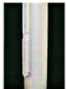
Belegklampe mit aufliegendem Deckel, sperrbar