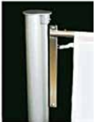
Mastkopf mit Langschlitten, Teleskopausleger