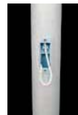
Bediengehäuse SFS, Perlon-Hisuseil