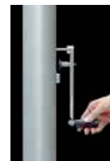
Kurbel- Hissvorrichtung FlagLift